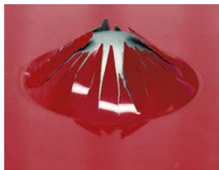
Test des ventouses