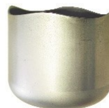
Test de la coupe d'emboutissage