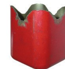
Test de la tasse carrée